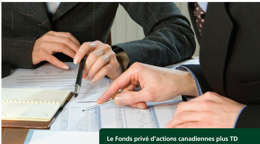
Le Fonds privé d'actions canadiennes plus TD privilégie les sociétés de croissance de grande qualité.