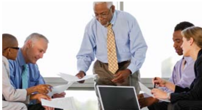
Au cours des prochaines années, pour bon nombre de Canadiens, l'évaluation de la valeur de leur entreprise constituera une question urgente.

commence par un plan d'urgence, qui prévoit un mandat en cas d'incapacité ou une procuration relative aux biens perpétuelle (ou l'équivalent), un testament à jour et une protection d'assurance vie et d'assurance invalidité suffisante.