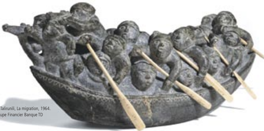
Joe Tallirunili, La migration, 1964. Groupe Financier Banque TD

sur la route une collection d'art inuit de renommée mondiale dans le cadre d'une tournée de six villes canadiennes afin de permettre aux Canadiens d'admirer cette impressionnante collection de plus près. Par ailleurs, nous commanditerons la plus récente édition de l'Atlas canadien en ligne.